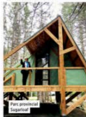
Parc provincial Sugarloaf