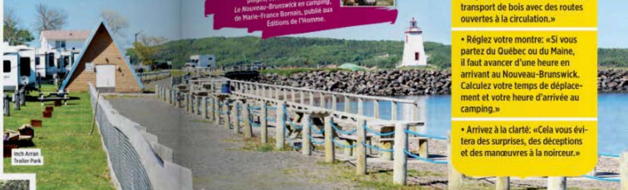
Inch Arran Trailer Park