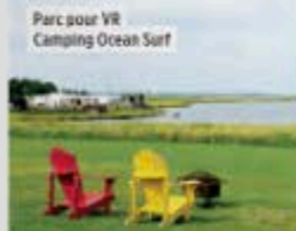
Parc pour VR Camping Ocean Surf

• Parc pour VR Camping Ocean Surf: Un vaste domaine qui accueille les plus gros VR de l'industrie. Situé près de la plage Parlee, il bénéficie également d'une belle vue sur un marais donnant accès en kayak à la plage.